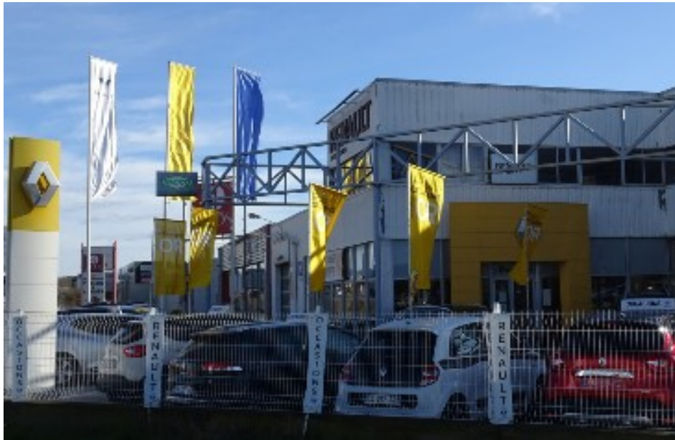
Enseignes scellées au sol ou installées directement sur le sol.

Les zones qui ne sont pas couvertes par des dispositions spécifiques sont soumises à celles du règlement national de publicité qui vaut alors RLPi sur ces zones.