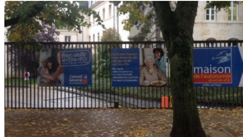
Enseignes sur clôture.

Dès l'entrée en vigueur du RLPi, toute installation d'une enseigne sur le territoire d'une commune membre est soumise à demande d'autorisation préalable.